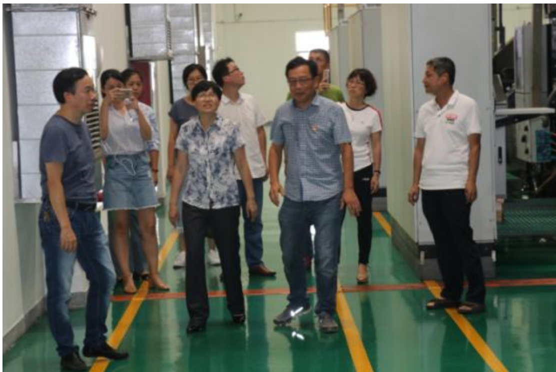
莆田市涵江区总工会来我司参观