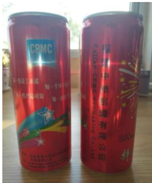
公司为可口可乐公司生产的样品罐