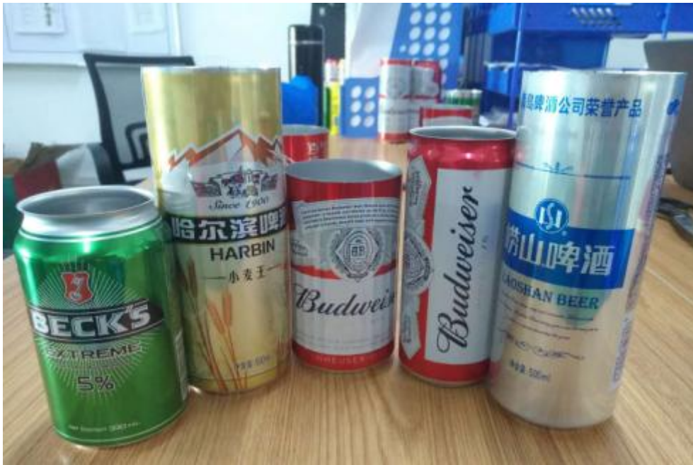
公司部分产品实拍

我司目前可以生产 330ml/500ml/sleekcan 三种罐型，其中设计速度：330ml(2400CPM)，500ml(2200CPM)；在3月份已调试生产 SLEEK 罐型。2017年产量3.4亿，2018年上半年2.8亿。